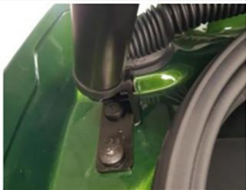
1. 拆掉原车支架更换我司支架，加螺丝