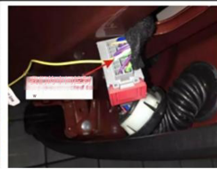
8. 我们的黄色中控线连接到白线（从右到左，第一排第四个空格）