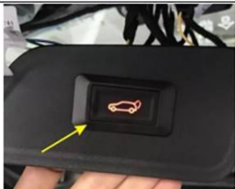
13. 钻一个孔并安装我们的后挡板开关按钮。