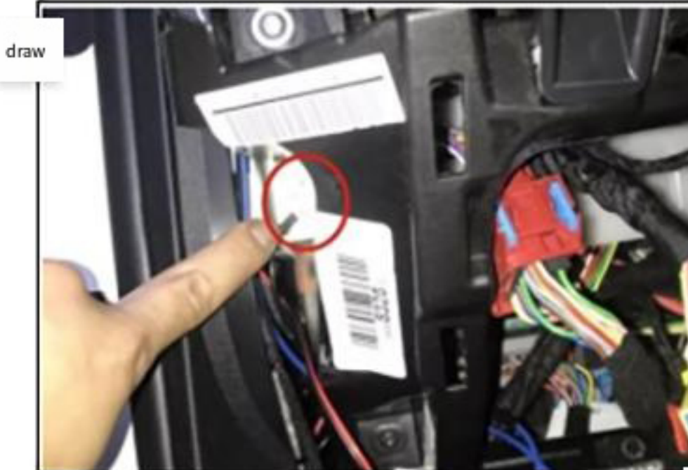
7. 找到驱动器侧的接地螺钉并将其连接到地线。