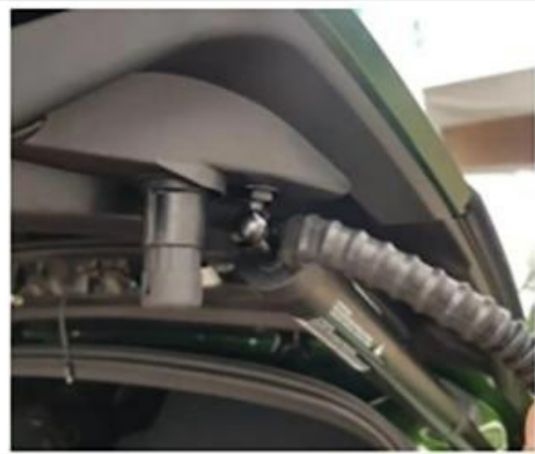
2. 安装我们的电动撑杆，撑杆线向上