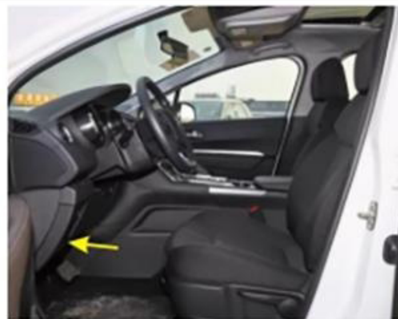
5. 拆下驾驶员方向盘下方的装饰板，找到原车电源。