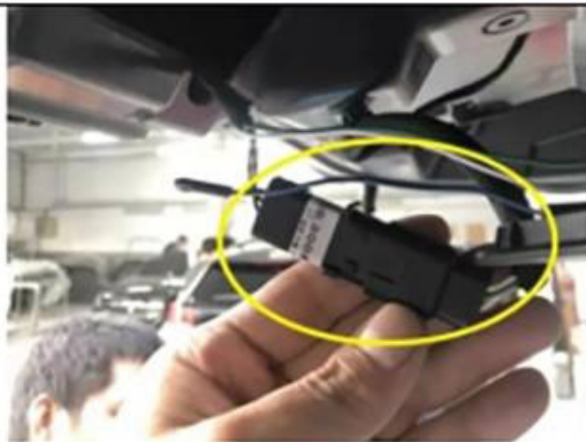
12. 原车尾门锁插头对插