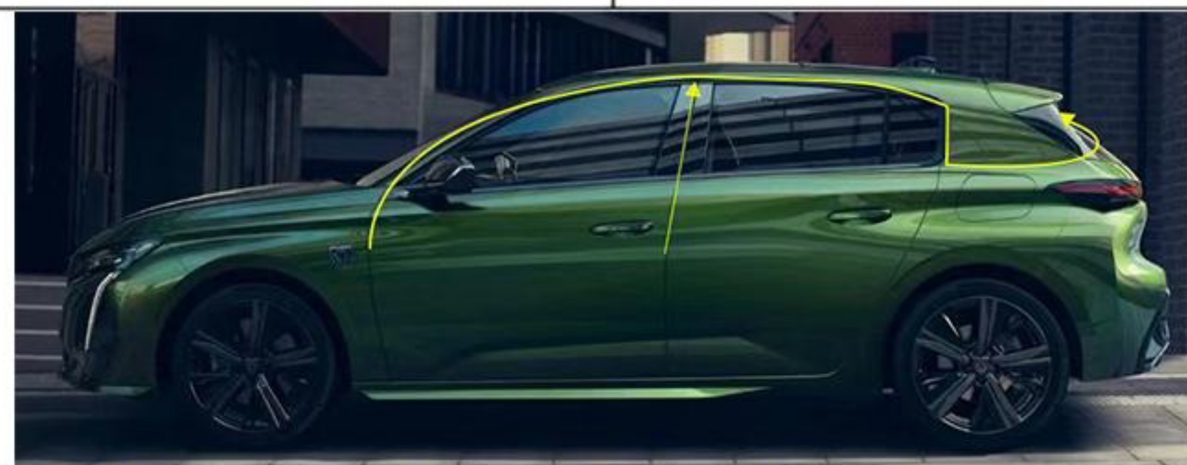
9. 电源线和黄色中控电缆沿黄色箭头布线到尾门。